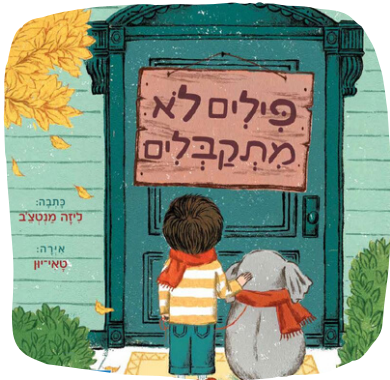
פילים לא מתקבלים.

בסיכום התשובות של התלמידים כדאי להאיר את תשומת ליבם לבעייה החברתית הבאה: