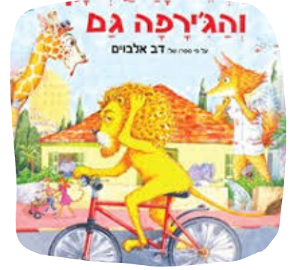
האריה הרעמתן והג'ירפה גם...

נקודות מבט, מקובעות מחשבתית. מה אני מכיר והאם מה שאני מכיר גם האחר מכיר... נורמות התנהגותיות בהתאם להכרות אישית.