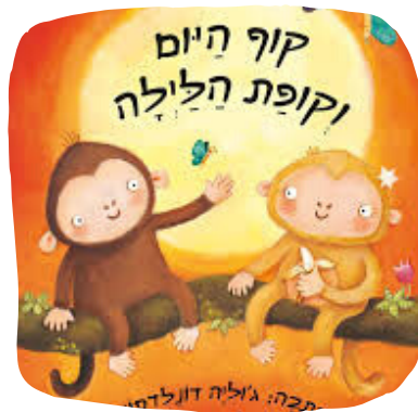
קוף היום וקופת הלילה.

קבוצות / חבורות סגורות שבחרות לא לקבל אליהן חברים חדשים.